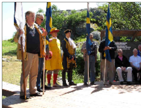
Fanborgen och soldater.